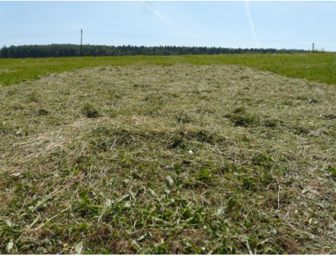
Das Spender-Mahdgut wurde gleichmäßig auf der vorbereiteten Fläche verteilt.