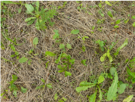
Das übertragene Mahdgut bleibt auf der Fläche und kann als Verdunstungsschutz dienen.